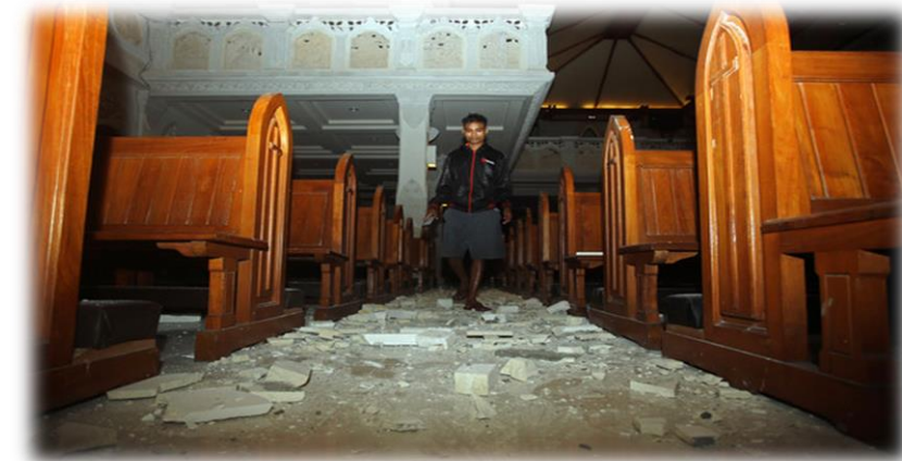
教堂內天花板掉落。