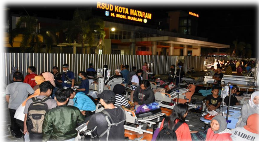
傷患聚集在龍目島馬塔蘭市的醫院外。(圖／路透)

資料來源： https://kairos.news/114539 & https://news.tvbs.com.tw/world/968854 & https://tw.news.appledaily.com/international/realtime/20180809/1407674/